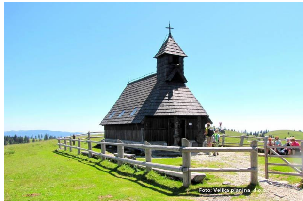
Црква Марије Снежне

Пријаве уз комплетну уплату превоза 12000 динара и планинарском легитимацијом са плаћеном чланарином за 2024.