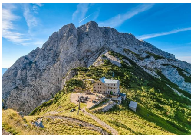
Цојзова коча и врх Гринтовец

Смештај је у дому Цојзова коча у вишекреветним собама са постељином. Дом има кантину и воду, купатила нема.